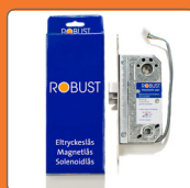
ROBUST ELEKTRISK LÅS